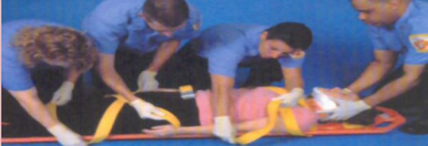
منبع: مبنای کمک های اولیه ، ترجمه: دکتر نادر سید رضوی

(ب) درمان مصدومین بیهوش (دچار آسیب دیدگی نخاع) اهداف درمانی: