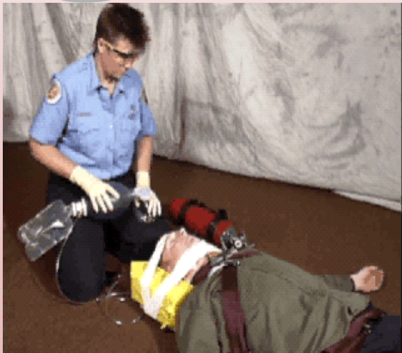
تهیه کننده :